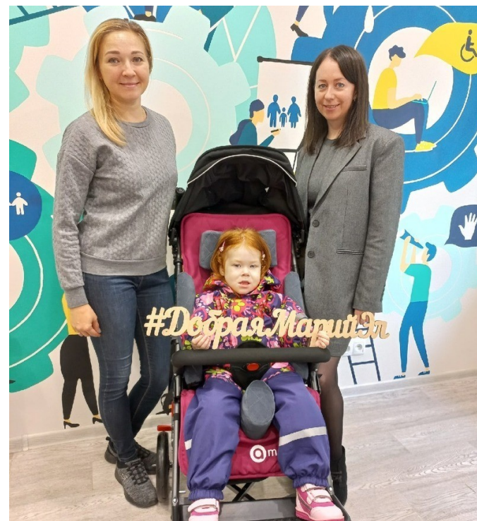
Ева на новой коляске