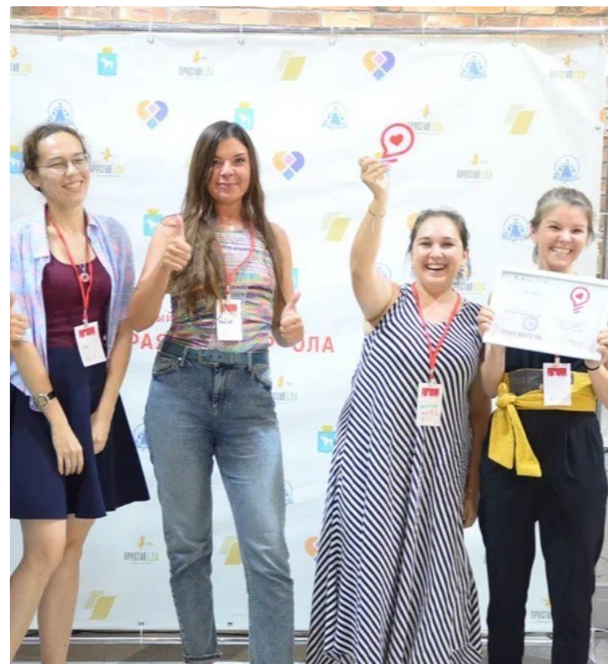
Победители социального хакатона «Добрая Йошкар-Ола»