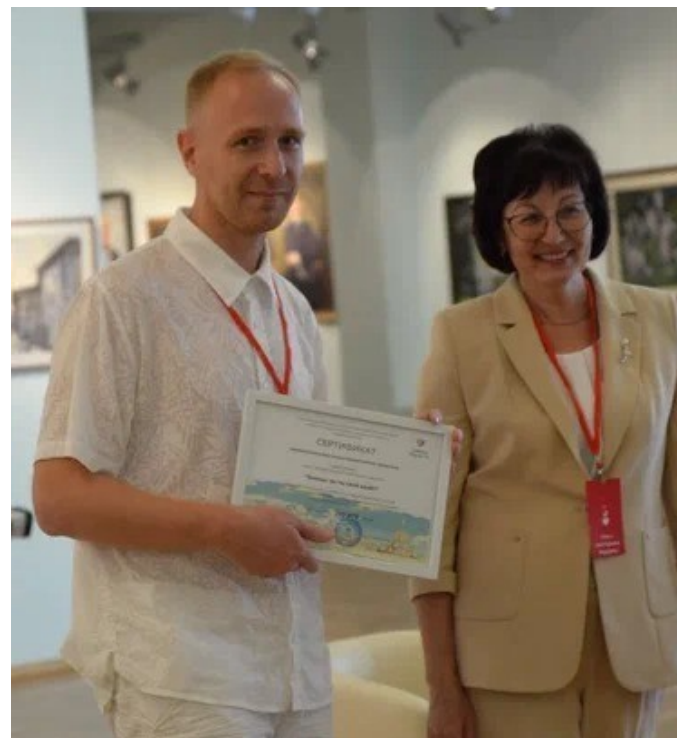
Вручение сертификатов на получение субсидий для реализации проектов