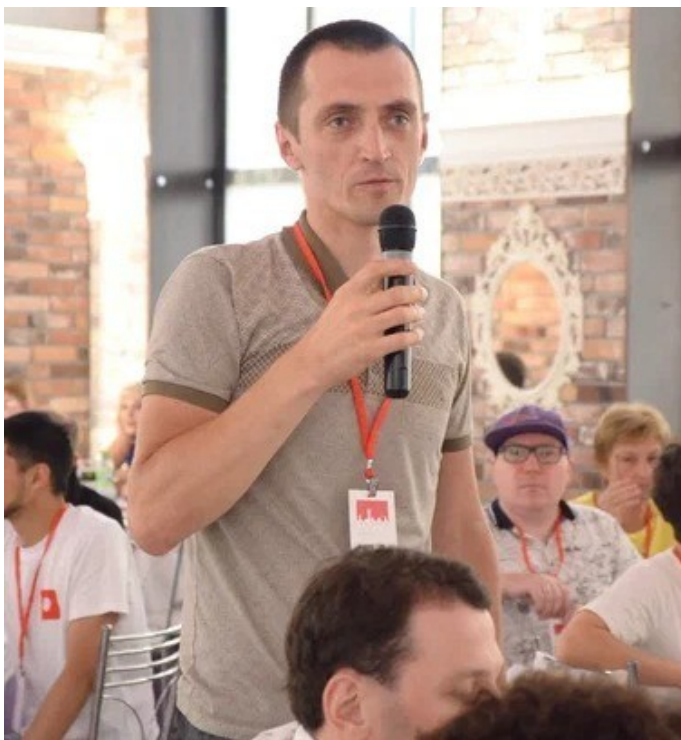
Участник социального хакатона «Добрая Йошкар-Ола»