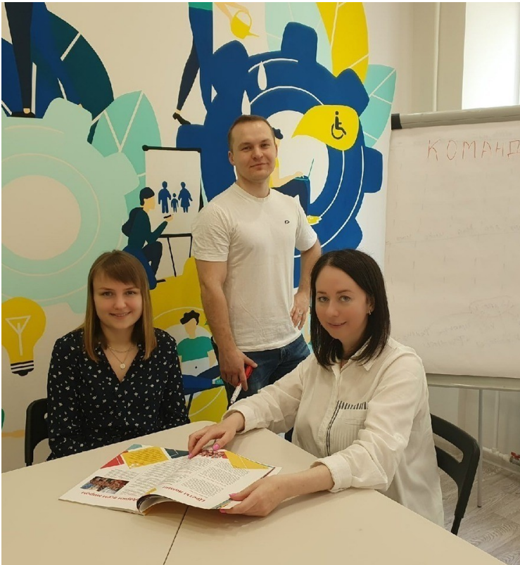
Команда РБОО «Добрая Марий Эл»