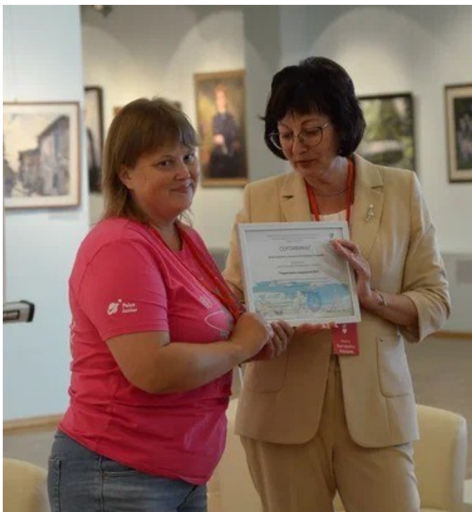
Руководитель проекта получает заслуженную награду